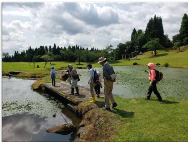
歩いて散策☆自然観察会

【所見】 長岡市の指導により、新型コロナウイルス感染拡大防止のため4月1日～5月31日まで閉園。繁忙期であるゴールデンウィークのキャンプ場利用ができなかったことや年間を通じて県外からの利用制限などもあり、利用者数は大幅減となったが、昨今のキャンプブームのため冬期閉鎖直前までキャンプ場の利用者がいた。 自主事業については、外部講師・団体に委託を行い、新型コロナウイルス感染予防策を行いながら実施した。 施設の利用者減少対策、公園の活性化対策として、市と協議を行いながらスポーツ利用に限定せず、様々な利用ができることをPRし、「コスプレ利用」など各施設の特徴を生かした利用促進を行っている。