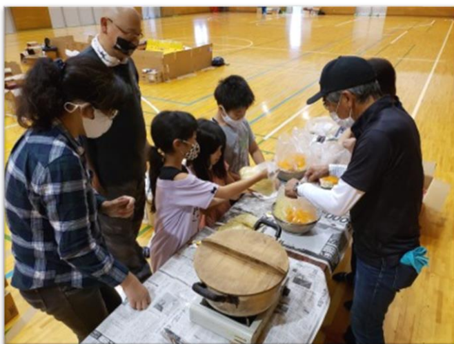
防災体験キャンプ

中越大震災メモリアル施設としての見学よりも、交流の場・カフェとして利用されるケースが増えた。“あそびから学ぶ防災”というテーマで防災学習イベントを行いつつ、“いつでも誰かと繋がれる”交流の場としての川口きずな館を通して中越大震災を知ってもらうことで、震災の記憶である「5000人の絆」を語り継いでいく。