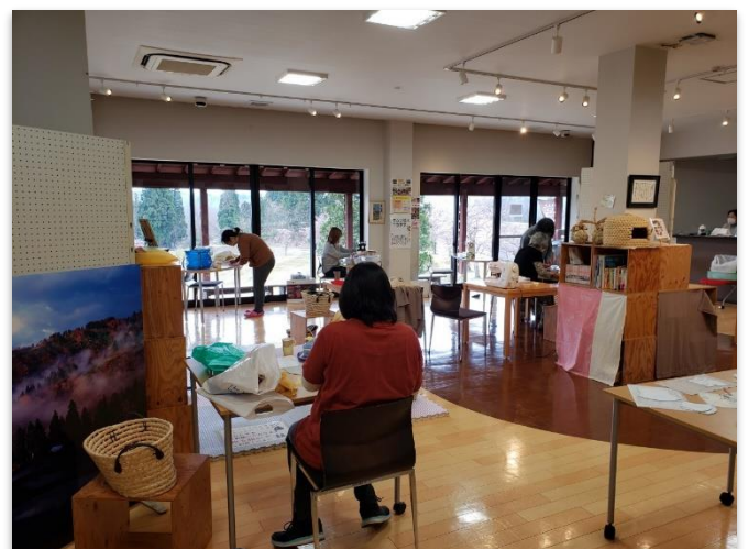
つきいち手芸カフェ