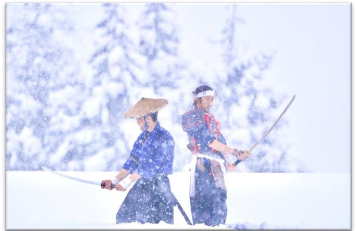
雪上コスプレ撮影会