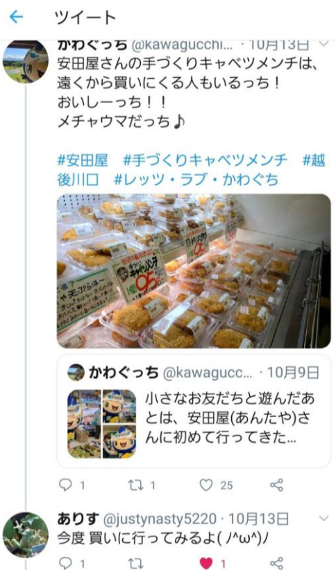
かわぐっちの活動