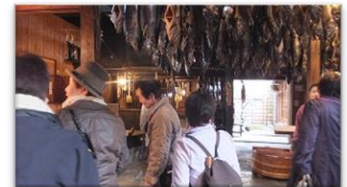
2019年度 村上市買い物ツアー

【所見】 会員同士で集まり、和気あいあいと開催していた。 再度開催を望む声も多かった。